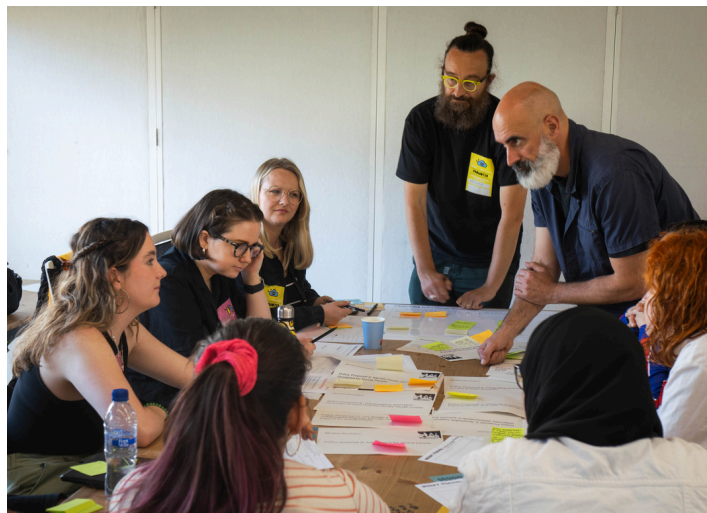
Taller con jóvenes de Manchester y Barcelona en los Diálogos del proyecto Mindset Revolution en Barcelona

A lo que hay que añadir las variables laborales, puesto que las personas en España que se encuentran en paro destacan en el porcentaje de problemas de salud mental frecuentes (23,3%). De hecho, el 19,7% de jóvenes españoles de clase alta o media alta acude muchas veces al año a servicios médicos, frente a alrededor del 10% en el caso del resto de jóvenes según clase media y baja. Siendo el motivo principal por el que las personas jóvenes dicen no acudir a la ayuda profesional para paliar sus problemas de salud mental la cuestión económica (37,8%).