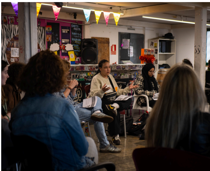
Taller con jóvenes de Manchester y Barcelona en los Diálogos del proyecto Mindset Revolution en Barcelona

Una de las metodologías utilizadas fue el Teatro Legal, mediante el cual los participantes trabajan para desafiar las opresiones a las que se enfrentan y buscar aliados. Durante la representación, un público compuesto por miembros de la comunidad y responsables políticos desempeña el papel crucial de espect-actores.