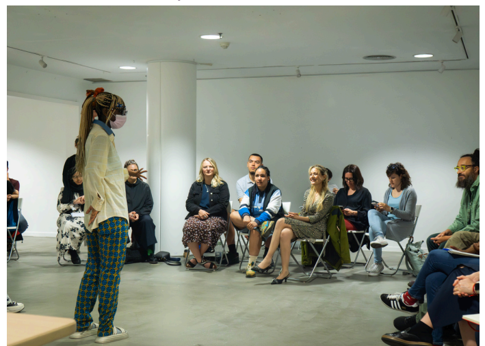
Taller con jóvenes de Manchester y Barcelona en los Diálogos del proyecto Mindset Revolution en Barcelona

En lo que respecta al sistema de salud mental, en el Reino Unido existe una falta crónica de financiación, lo que significa que alrededor del 75% de los jóvenes que experimentan un problema de salud mental se ven obligados a esperar hasta que su condición empeore o no pueden acceder a ningún tratamiento en todo. Según los médicos del Reino Unido, los niveles de financiación y personal no son suficientes para proporcionar un apoyo adecuado a la salud mental. Además, el aumento de las presiones en todo el sistema de salud mental tiene un efecto directo en el bienestar y la moral del personal. En 2023, el Comité de Cuentas Públicas informó que las presiones sobre el personal de salud mental del NHS están provocando un círculo vicioso de escasez de personal. En 2021/22, 17.000 (12%) miembros del personal abandonaron la fuerza laboral de salud mental del NHS, lo que representa un aumento significativo con respecto a los niveles pre pandémicos. Se informó que los problemas de salud mental son una de las principales causas de enfermedad del personal.